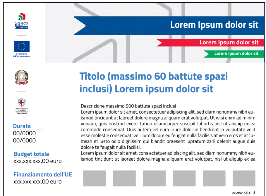
Esempio di targa beneficiario

La targa deve essere visibile, le sue dimensioni dipendono dalle caratteristiche dell'opera (formato minimo A4) e dall'ambito in cui va esposta.